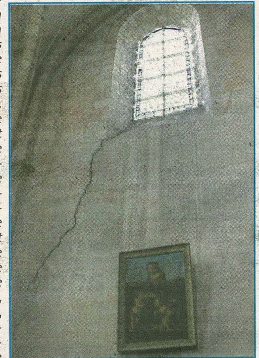
Une immense fissure traversante est visible sur l'un des murs.